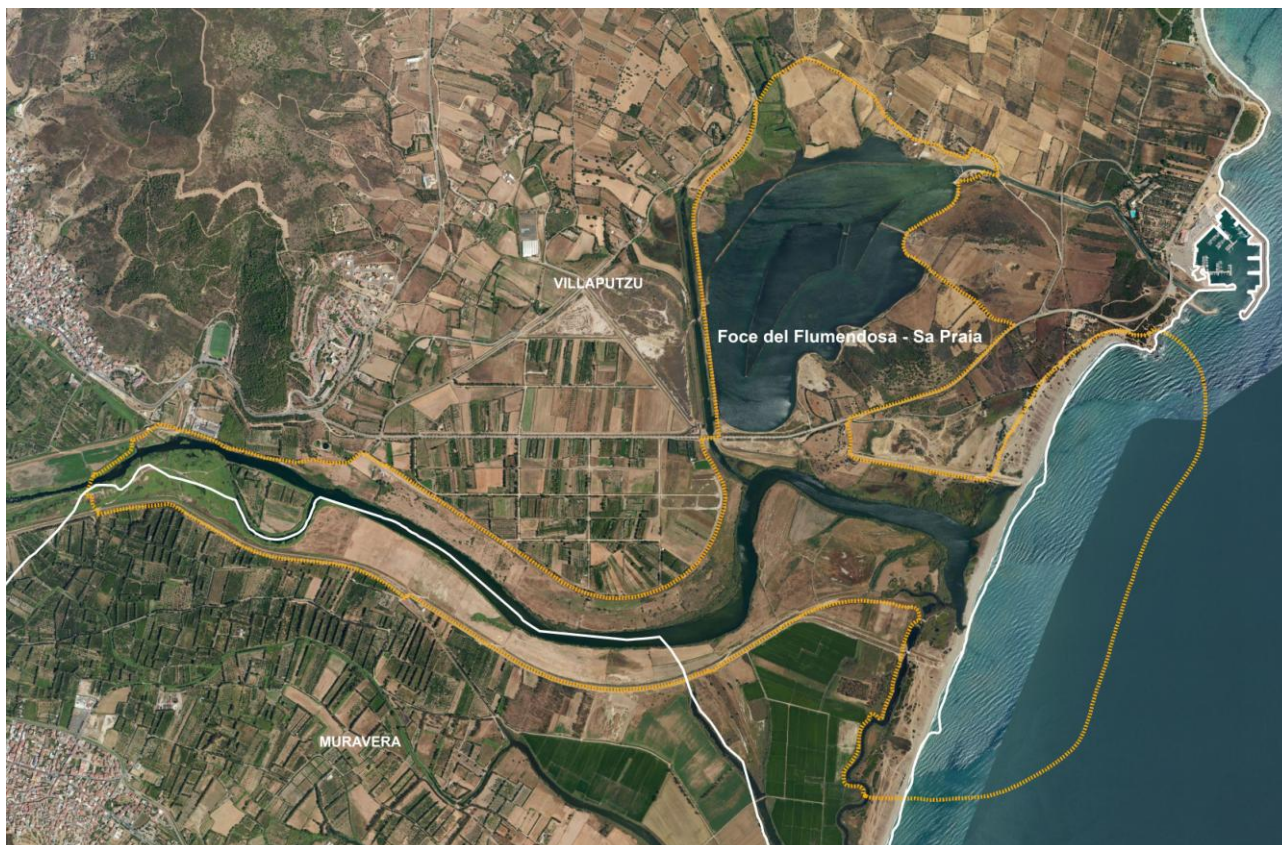
Figura 1 Sic ITB040018 - "Foce del Flumendosa - Sa Praia"