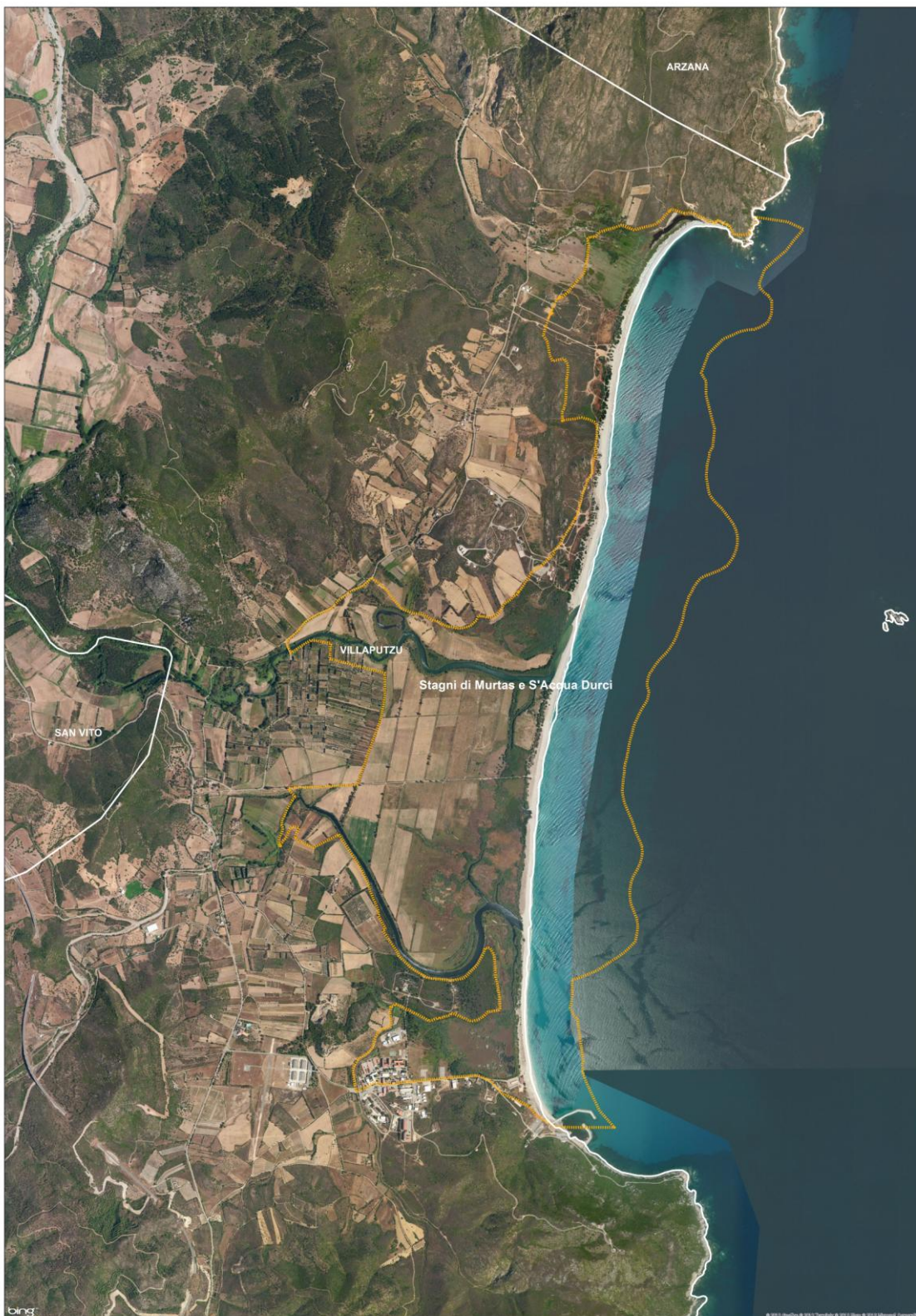
Figura 2 Sic ITB040017 – “Stagni di Murtas e S’Acqua Durci”